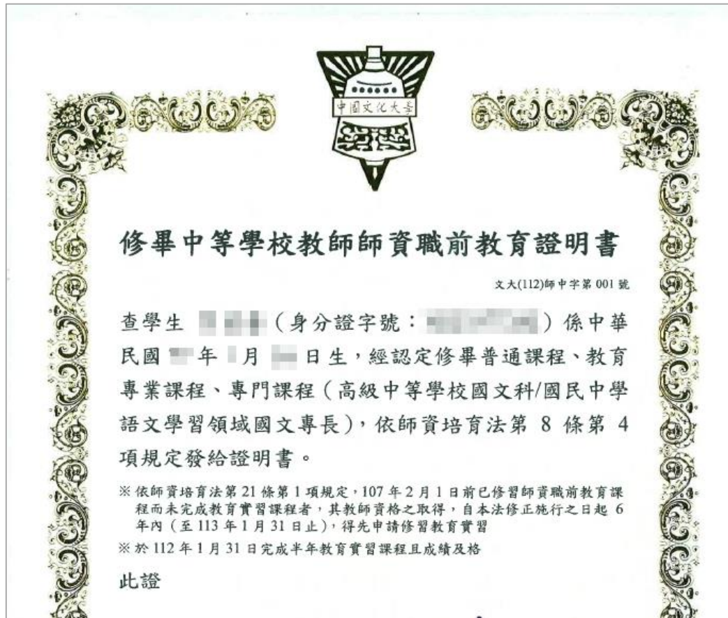
舊制格式 (先實後檢)