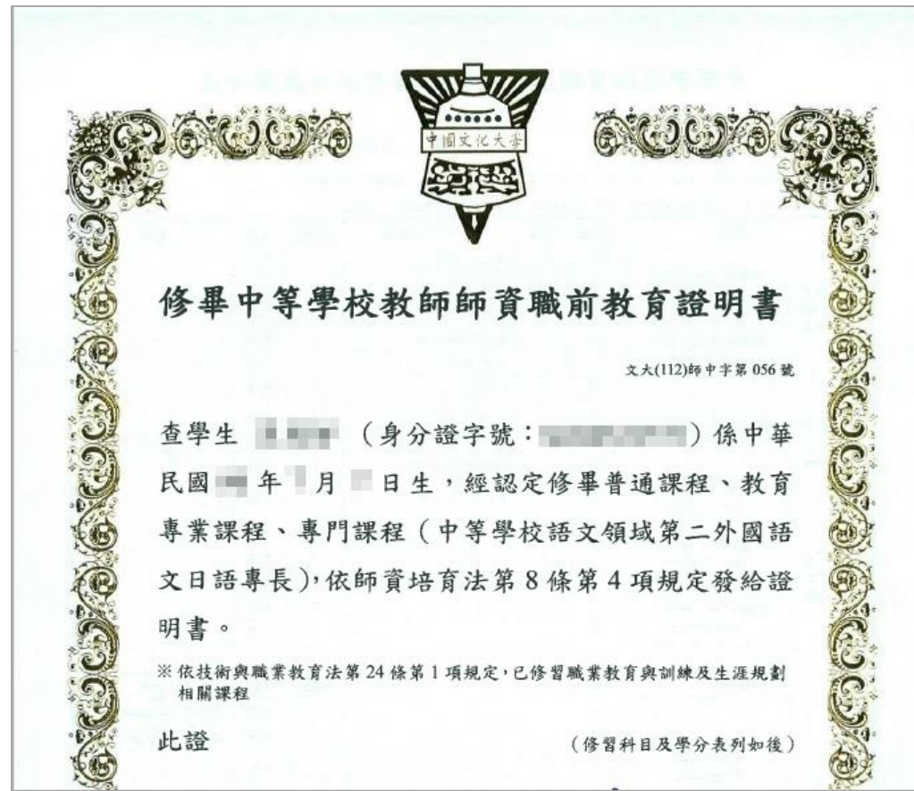
新制格式 (先檢後實)